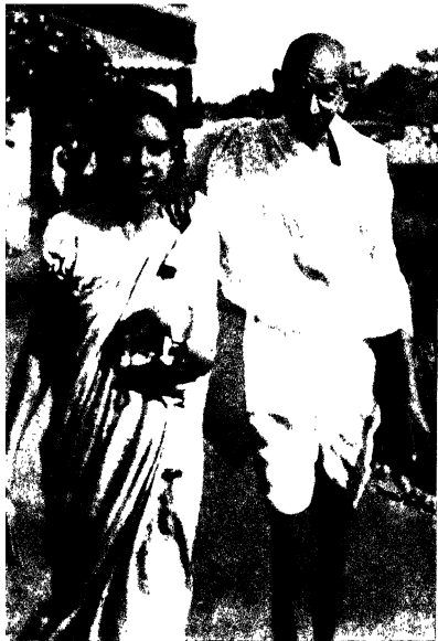
लेखिका बापू के साथ